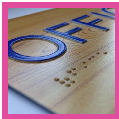
Impressão em relevo/braile