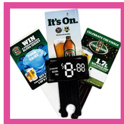
Impressão para PDV